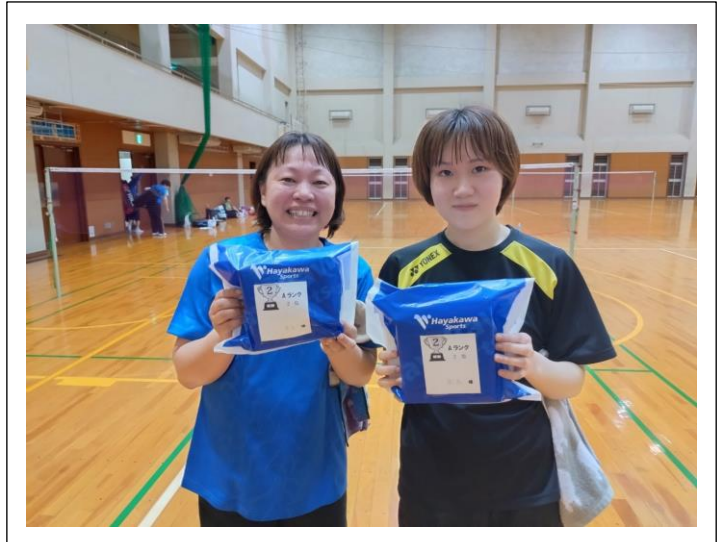
A ランク 2 位