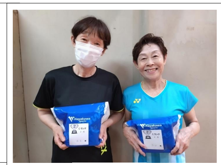
C ランク 2 位