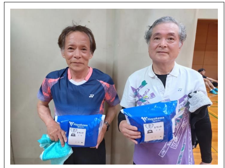
B ランク 2 位